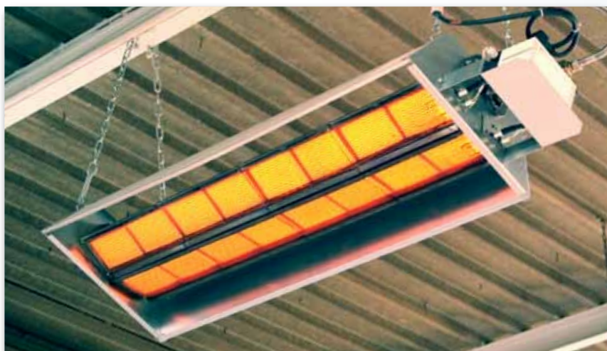
Infrazářič s keramickou sálavou plochou